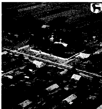
Rys. 5 Układ przestrzenny wsi Trześcianka z lotu ptaka

„Trześcianka położona jest wzdłuż drogi wojewódzkiej nr 685, na trasie biegnącej z miasta wojewódzkiego Białystok w kierunku miasta powiatowego Hajnówka. Zdecydowana większość zabudowań domowych położona jest właśnie wzdłuż tej drogi. Przy drodze nr 685, w centralnej części wsi, znajduje się drewniana, zabytkowa cerkiew parafialna p.w. Św. Michała Archaniola, a także budynek świetlicy wiejskiej, gdzie funkcjonuje filia Gminnej Biblioteki Publicznej w Narwi oraz strażnica Ochotniczej Straży Pożarnej. Od drogi wojewódzkiej odchodzą cztery drogi powiatowe biegnące w kierunku miejscowości Puchły, Soce, Białki oraz Saki, a także dwie drogi gminne. Jedna z nich wiedzie w stronę cmentarza w Trześciance, na którym zlokalizowana jest cerkiew p.w. Ofiarowania Najświętszej Marii Panny.