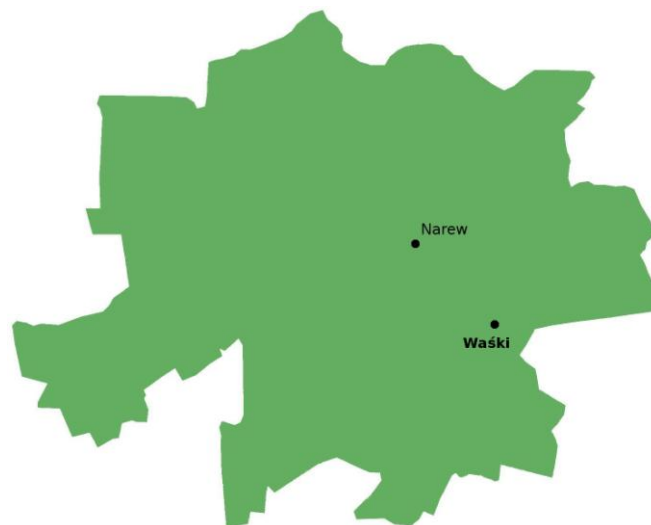
Rys. 2 Położenie miejscowości Waški na tle Gminy Narew

Miejscowość Waški położona jest wzdłuż drogi gminnej nr 107153B. Wieś oddalona jest o około 50km od stolicy województwa Białegostoku oraz o około 20km od miasta powiatowego Hajnówka.