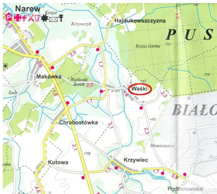
Rys. 5 Sieć drogowa w obrębie wsi Waški

Stan techniczny dróg w okolicach miejscowości Waški można określić jako zadowalający. Najgorszy stan techniczny, szczególnie w okresach jesienno-wiosennych, posiadają żwirowe drogi gminne, a także bitumiczny odcinek drogi gminnej prowadzący przez miejscowość Waški. Zarządcą i administratorem dróg powiatowych jest Powiatowy Zarząd Dróg z siedzibą w Hajnówce, natomiast zarządcą dróg gminnych jest referat gospodarki komunalnej i rolnictwa Urzędu Gminy Narew.