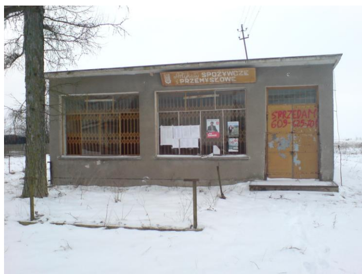
Rys. 6 Stary budynek przeznaczony na świetlicę wiejską

W celu utworzenia świetlicy wiejskiej w Waškach Gmina Narew zakupiła budynek po starym sklepie (rys. 6) z przeznaczeniem na świetlicę. Budynek ten gmina zamierza wyremontować i oddać do użytku mieszkańcom wsi. Zadanie to gmina planuje zrealizować przy wsparciu finansowym w ramach działania „Odnowa i rozwój wsi” Programu Rozwoju Obszarów Wiejskich 2007-2013.