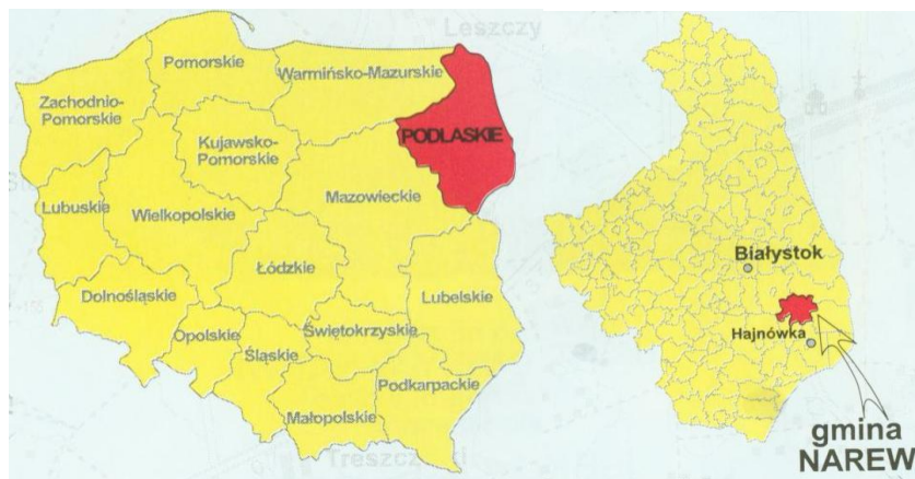
Rys. 1 Położenie Gminy Narew na tle województwa i kraju

Miejscowość Waški to niewielka wieś Gminy Narew, położona we wschodniej części gminy w bliskim sąsiedztwie Puszczy Białowieskiej. Gmina Narew znajduje się w południowo – wschodniej części województwa podlaskiego i wchodzi w skład powiatu hajnowskiego. Gmina graniczy od zachodu z gminami Zabłudów oraz Bielsk Podlaski, od północy z gminą Michałowo, od wschodu z gminą Narewka, zaś od południa z gminami Czyże i Hajnówka.