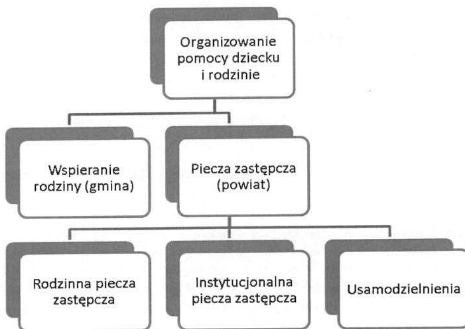
Rysunek 1. Organizacja pomocy dziecku i rodzinie

Organizację pomocy dziecku i rodzinie oraz podział kompetencji w zakresie organizacji pomocy dziecku i rodzinie pomiędzy samorządami przedstawiają rysunki 1 i 2.