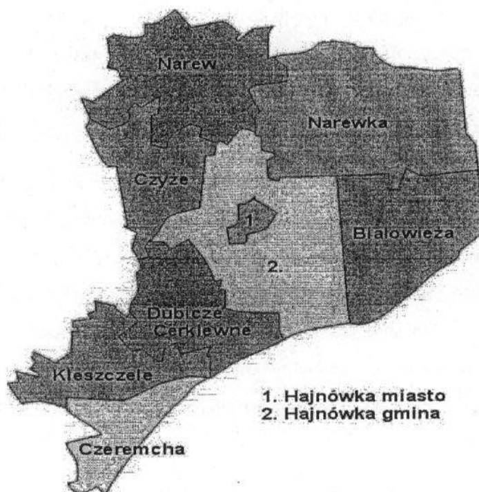
Rycina 1. Gmina Narew na tle powiatu hajnowskiego

Według danych Powszechnego Spisu Rolnego przeprowadzonego w 2010 roku, w Gminie Narew było zarejestrowanych 1051 gospodarstw rolnych, z czego 1047 to gospodarstwa indywidualne. Największą liczbę odnotowano dla gospodarstw rolnych o powierzchni 1–5 ha (25%), zaś najmniejszą dla gospodarstw o powierzchni powyżej 15 ha (15%). Działalność rolniczą prowadziło ogółem 857 gospodarstw rolnych. 395 gospodarstw utrzymuje zwierzęta gospodarskie. Łączna liczba pogłowia zwierząt gospodarskich w sztukach dużych wynosi 14251 sztuk.