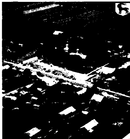
Rys. 5 Układ przestrzenny wsi Trześcianka z lotu ptaka

„Trześcianka położona jest wzdłuż drogi wojewódzkiej nr 685, na trasie biegnącej z miasta wojewódzkiego Białystok w kierunku miasta powiatowego Hajnówka. Zdecydowana większość zabudowań domowych położona jest właśnie wzdłuż tej drogi. Przy drodze nr 685, w centralnej części wsi, znajduje się drewniana, zabytkowa cerkiew parafialna p.w. Św. Michała Archanioła, a także budynek świetlicy wiejskiej, gdzie funkcjonuje filia Gminnej Biblioteki Publicznej w Narwi oraz strażnica Ochotniczej Straży Pożarnej. Od drogi wojewódzkiej odchodzą cztery drogi powiatowe biegnące w kierunku miejscowości Puchły, Soce, Białki oraz Saki, a także dwie drogi gminne. Jedna z nich wiedzie w stronę cmentarza w Trześciance, na którym zlokalizowana jest cerkiew p.w. Ofiarowania Najświętszej Marii Panny.