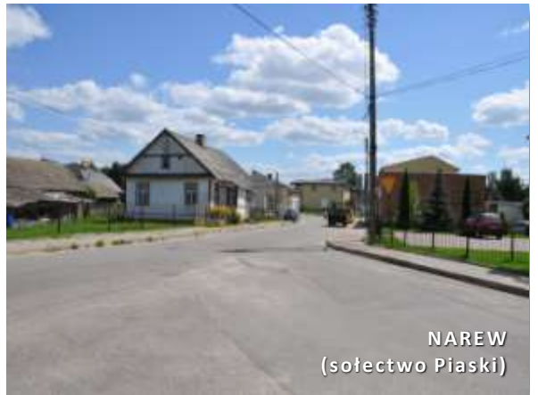
NAREW (sołectwo Piaski)