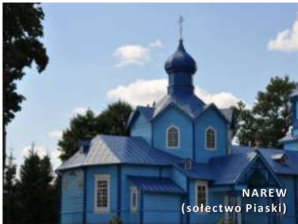
NAREW (sołectwo Piaski)