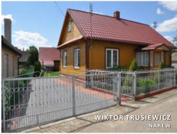
WIKTOR TRUSIEWICZ NAREW