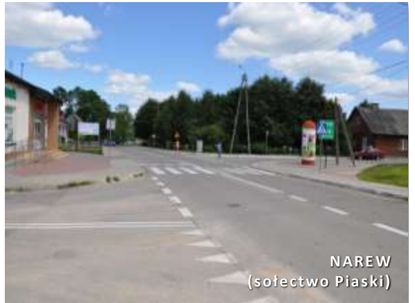
NAREW (sołectwo Piaski)