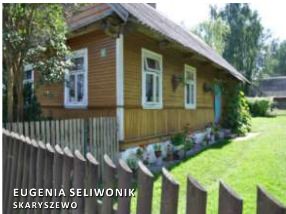
EUGENIA SELIWONIK SKARYSZEWO