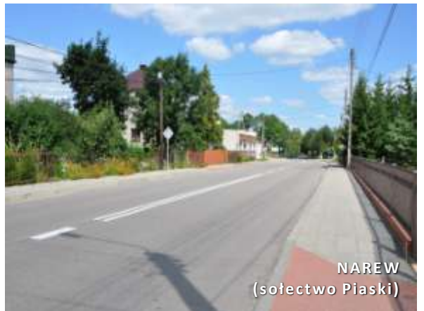
NAREW (sołectwo Piaski)