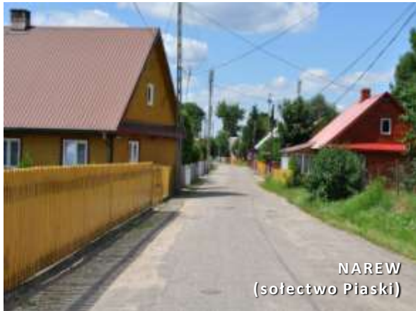
NAREW (sołectwo Piaski)