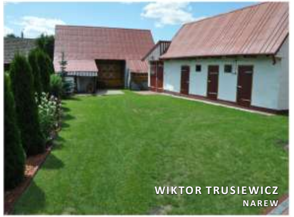
WIKTOR TRUSIEWICZ NAREW