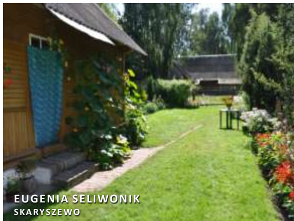
EUGENIA SELIWONIK SKARYSZEWO