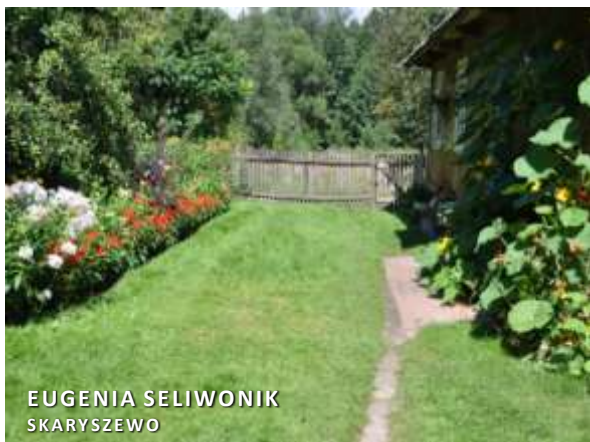
EUGENIA SELIWONIK SKARYSZEWO