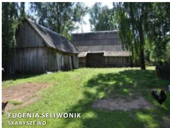
EUGENIA SELIWONIK SKARYSZEWO