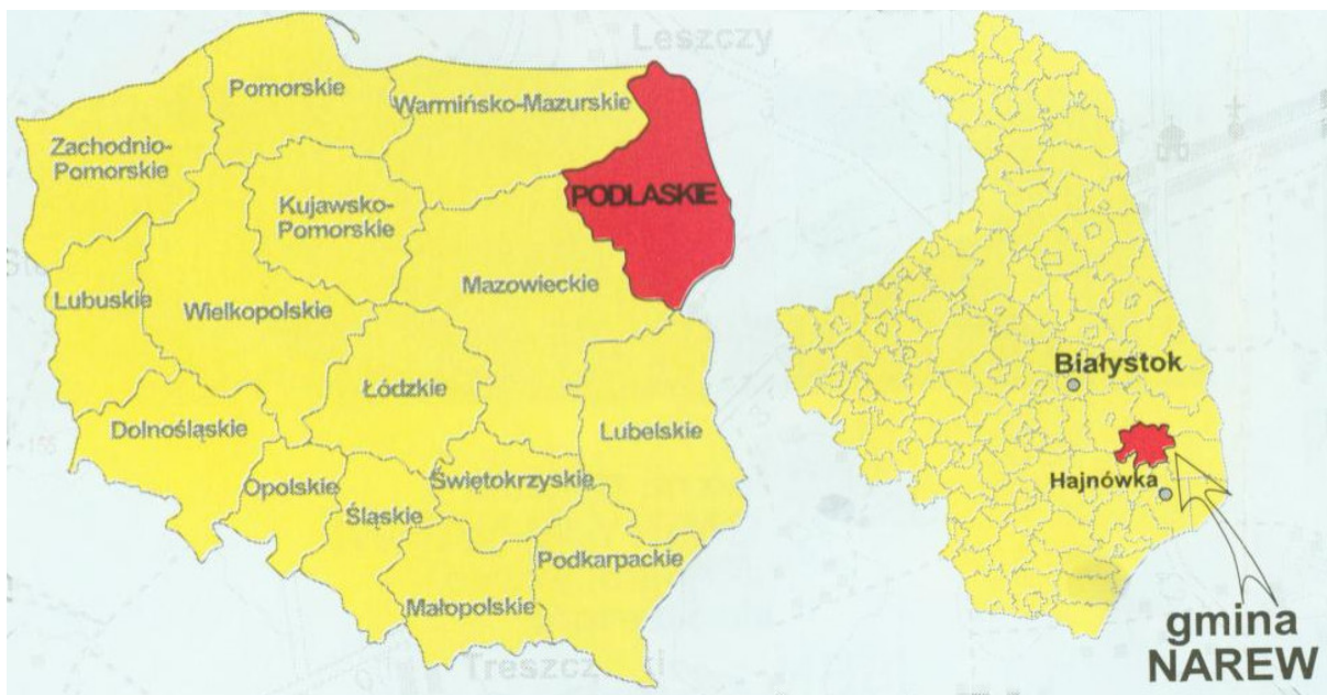
Położenie Gminy Narew.

Program Rozwoju Lokalnego identyfikuje problemy występujące na terenie Gminy Narew oraz sposoby i możliwości ich rozwiązania poprzez inwestycje na terenie gminy.